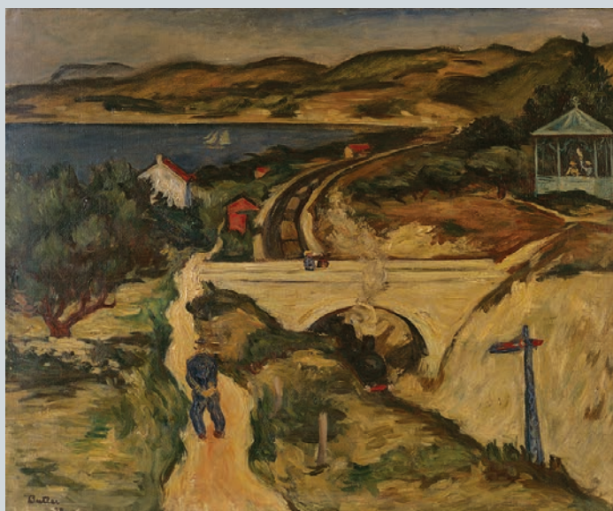
Horacio Butler - El paseo del jefe óleo sobre tela - 1930.

Se introducirá el Núcleo Histórico de la Colección, haciendo foco en la técnica pintura para luego contrastar con el grabado, la presencia del color, los contrastes, etc.