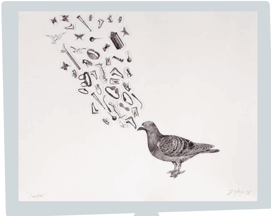
Zulema Maza. Cántico. Aguafuerte y collage, 1998.

Artista contemporánea que trabaja con variadas técnicas pero principalmente con distintas variantes del grabado. En sus obras, aparecen muchas figuras de animales, palomas, caballos, como protagonistas.