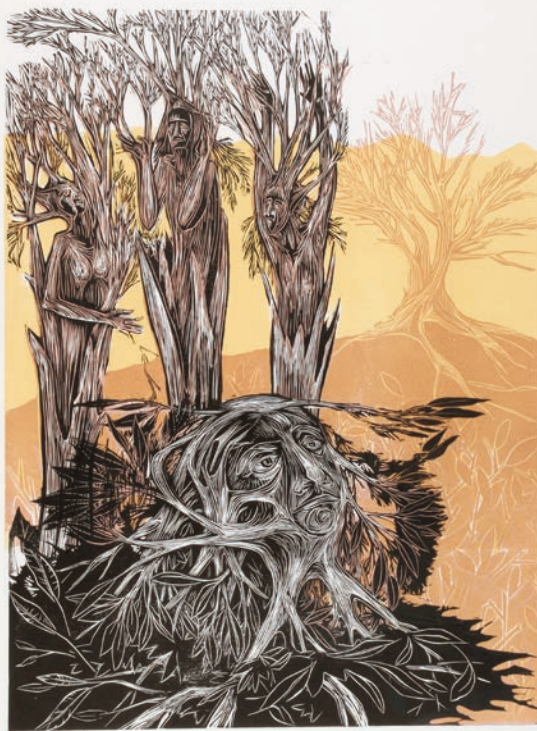
Eva Farji. Lo que te unía al bosque Grabado 2/10, 2013

Artista del grabado y la ilustración, nacida en Israel. Abordaremos las características de la técnica, pensando en los modos de representación, la abstracción y la creación de personajes.