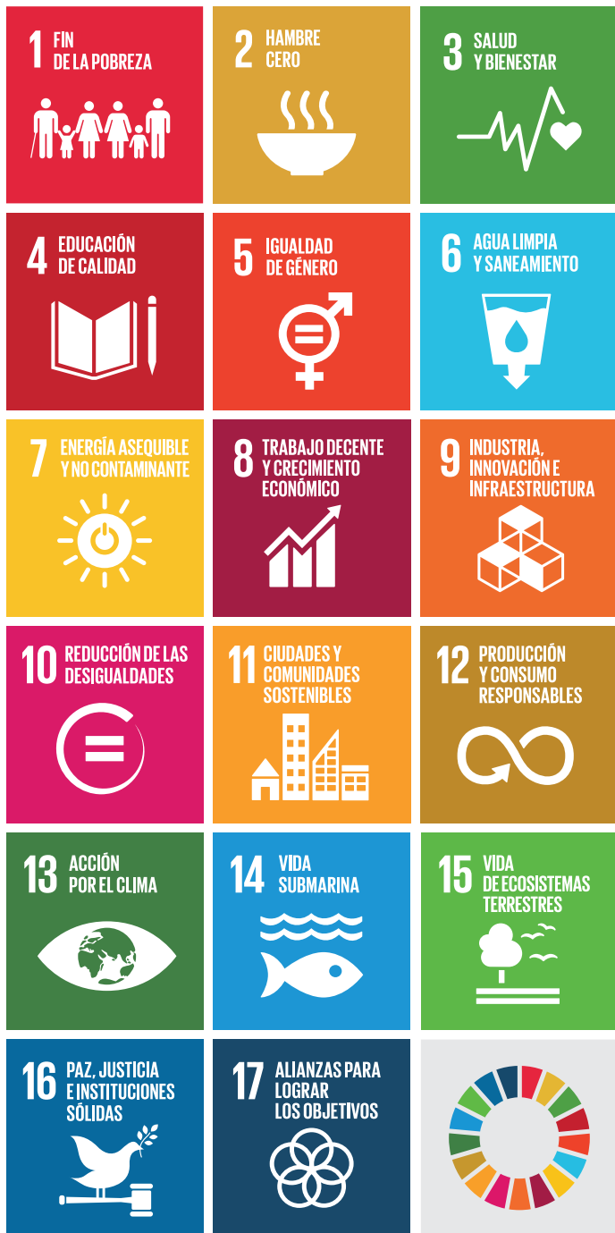
17 Objetivos de Desarrollo Sostenible