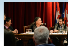
Seminario de Tratado de Personas en el ICCE