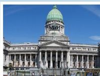
Presentación del primer informe del Consejo Federal