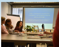
Ciclo de capacitaciones en Jefatura de Gabinete