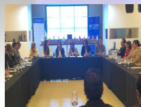
JORNADA NACIONAL DE IMPLEMENTACIÓN DEL SISTRATA FEDERAL