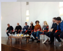
DESAYUNO-DEBATE EN LA UNSAM: ¿QUÉ ES LA EXPLOTACIÓN DE PERSONAS?