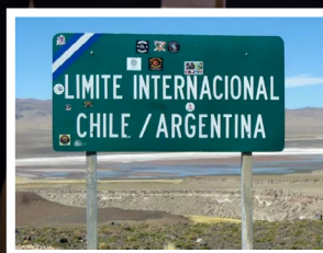
Se reunió el Comité de integración NOA - Norte Grande Argentina Chile