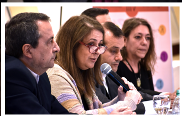
VIII Encuentro del Consejo Federal

Mauricio Macri presentó el Plan Nacional Bienal 2018-2020 de Lucha contra la Trata y Explotación de Personas