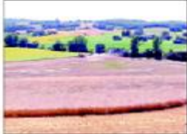
Paraná, Uruguay que muestra las prácticas de cultivo de soja en un campo de soja.