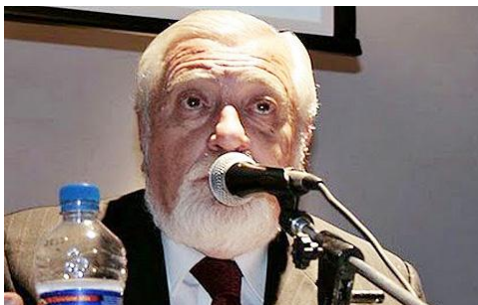
Eduardo Luis Duhalde, secretario de Derechos Humanos de Nación

La XII Reunión del encuentro se realiza este jueves y viernes en la Casa de las Culturas. La apertura estará a cargo del gobernador, Jorge Capitanich, y contará con la presencia del secretario de Derechos Humanos de Nación, Eduardo Luis Duhalde.