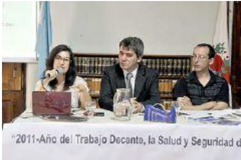
Integrantes del Registro Nacional de Chic@s Perdido@s disertaron sobre la problemática.

1 Integrantes del Registro Nacional de Información de Personas Menores Extraviadas estuvieron en la ciudad capital y disertaron sobre la situación actual de los niños perdidos en el país y en el territorio provincial, poniendo énfasis en el "chico como sujeto de derecho". También se reunieron con el ministro de Educación Walter Flores.